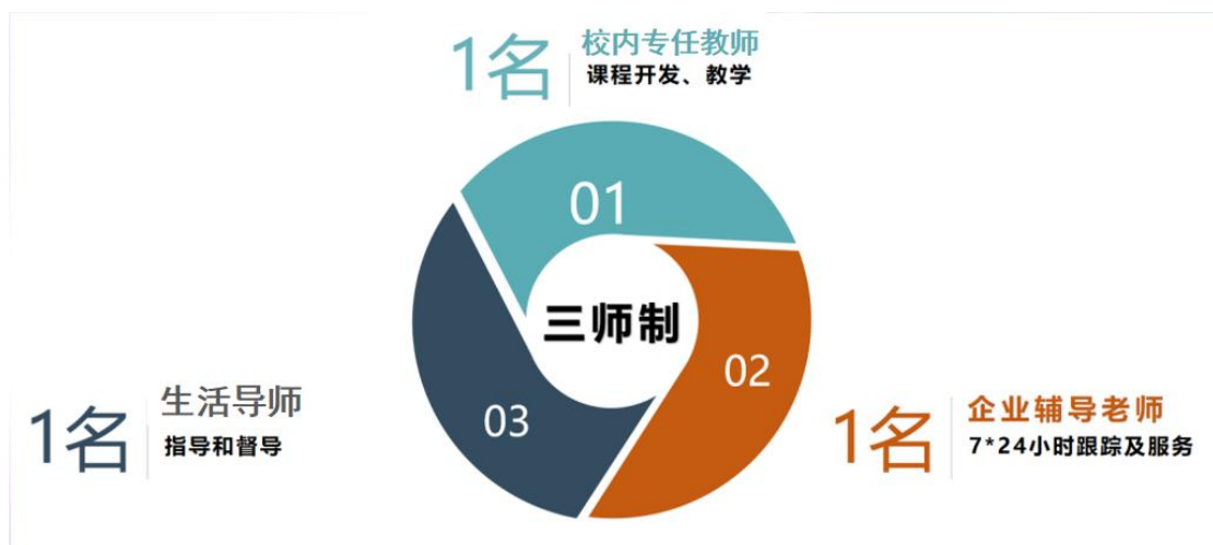
图 2“校内专任教师+企业一线教师+生活导师”的三师模式

广告艺术设计专业与福建骠骑网络科技有限公司等多家企业深入开展校企合作，企业从专业招生开始全程参与专业建设和人才培养工作。通过“校内专任教师+企业一线教师+生活导师”组成的三师模式（见图 2），形成线上+线下相结合的教与学新尝试，校内校外教师协同育人。在人才培养的过程中，坚持既重理论又重实践，将学生学习分为三个阶段进行进阶，第一阶段夯实专业基础，第二阶段演练岗位能力，第三阶段提升岗位技能。最后将三师与三创课程的融合，把三创教育融入到专业核心技能的实施上，构建网格化、多元化、递增式创新型技术技能人才培养链。