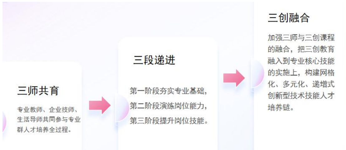
图 1“三师共育、三段递进、三创融合”的人才培养模式

广告艺术设计专业与福建骠骑网络科技有限公司等多家企业深入开展校企合作，企业从专业招生开始全程参与专业建设和人才培养工作。通过“校内专任教师+企业一线教师+生活导师”组成的三师模式（见图 2），形成线上+线下相结合的教与学新尝试，校内校外教师协同育人。在人才培养的过程中，坚持既重理论又重实践，将学生学习分为三个阶段进行进阶，第一阶段夯实专业基础，第二阶段演练岗位能力，第三阶段提升岗位技能。最后将三师与三创课程的融合，把三创教育融入到专业核心技能的实施上，构建网格化、多元化、递增式创新型技术技能人才培养链。