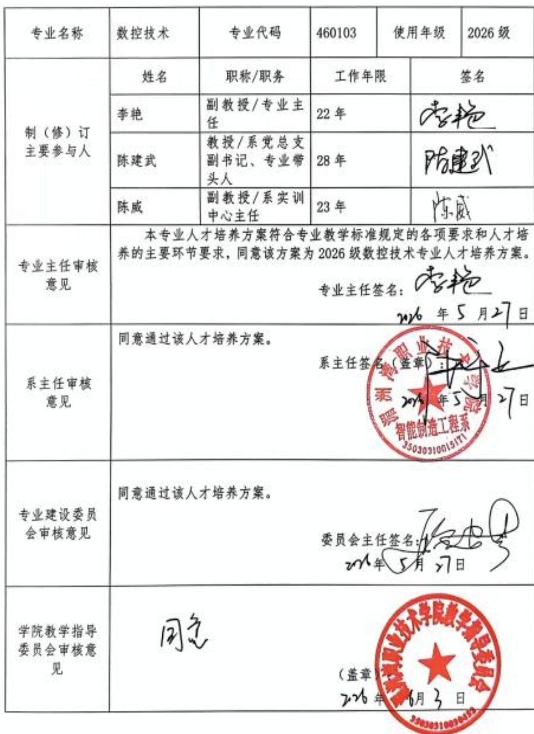
专业人才培养方案审核意见表