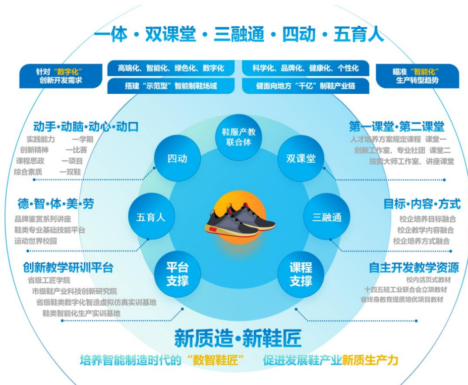
图1 “一体、双课堂、三融通、四动、五育人”数智鞋匠培养产教融合模式

在新质生产力背景下，莆田制鞋产业开展“智改数转”，鞋业数字化设计、智能化生产人才缺失，构建莆田市鞋服产教联合体，推行第一课堂和第二课堂并重，促进校企培养目标、教学内容、培养方式相融，校企合作搭建实训、科研、赛事、创业平台，构建校企无界化导师团，融入“动手、动脑、动心、动口”四动教学理念，打造“一学期、一项目、一双鞋”企业创新作品实践课程，实现五育并举，探索“一体、双课堂、三融通、四动、五育人”产教融合新模式，培养爱鞋、赏鞋、懂鞋的数智鞋匠。